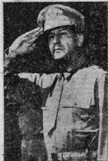
General MACARTHUR, quien contra-atacó con éxito ayer en Luzón